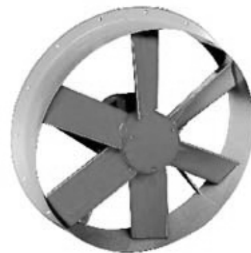
HCH HCH-SEC HCH-40C